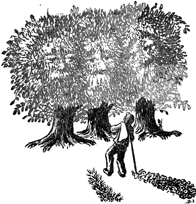
ביימער קומען אים אנטקעגן

וועגן און ניט געוואוסט, אויף וועלכן וועג זיך צו נעמען. האָט איין ברודער זיך גענומען רעכטס און איז אָנגעקומען צו אַ פינצטערער מבשמה (מאַכאַשיימע); דער צווייטער ברודער האָט זיך פאַרנומען לינקס — און איז אָנגעקומען צו אַ הייל מיט גולנים (גאַזלאַנים), און דער דריטער איז אָועק מיט דעם מיטלסטן וועג, אָבער מע ווייס ניט ביזן היינטיקן טאָג, וואו ער איז אָהינגעקומען. אַ טרויעריקע מעשה. גיי ווייס, מיט וועלכן וועג צו גיין. און ביי וועמען צו פרעגן איז ניטאָ.